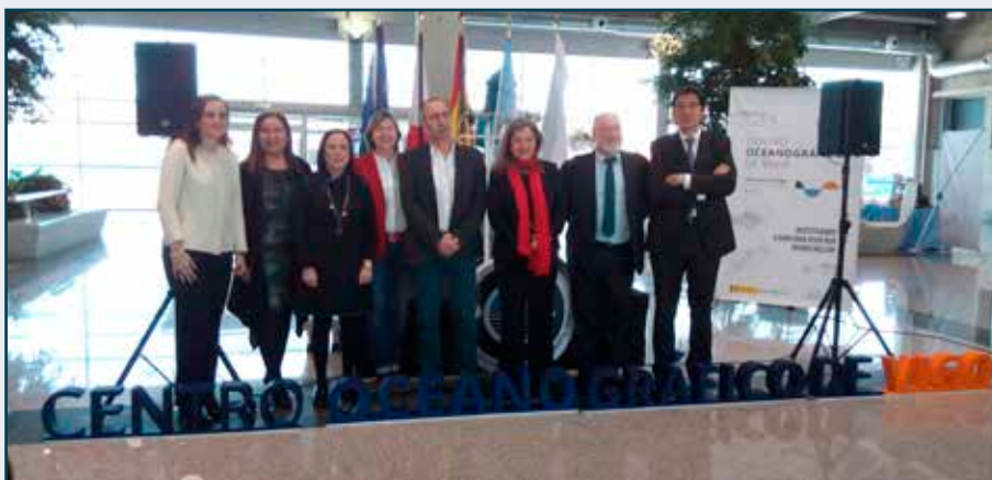
El Centro Oceanográfico de Vigo celebra su centenario con jornadas de puertas abiertas y la visita al buque de investigación Ángeles Alvariño.