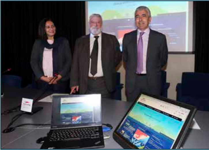
Presentación nueva página web corporativa del Puerto de Vigo.

Introducing the new Port of Vigo corporate website.