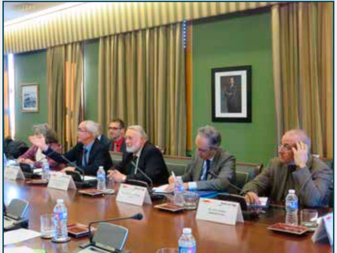
A delegation of deputies from the European Parliament, members of the Committee on Fisheries, visits the Port of Vigo.