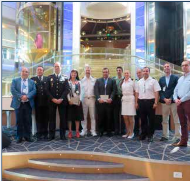
Visita de las fragatas "Almirante Juan de Borbón" y "Álvaro de Bazán" al Puerto de Vigo.

The frigates "Almirante Juan de Borbón" and "Álvaro de Bazán" visit the Port of Vigo