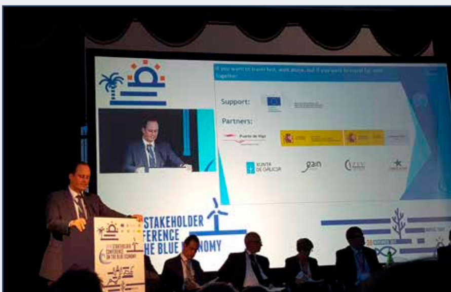
El Puerto de Vigo participa en Nápoles en la 1ª Conferencia de Economía Azul de la Unión Europea

The Port of Vigo attending in Naples in the 1 st Blue Economy Conference promoted by the European Union.