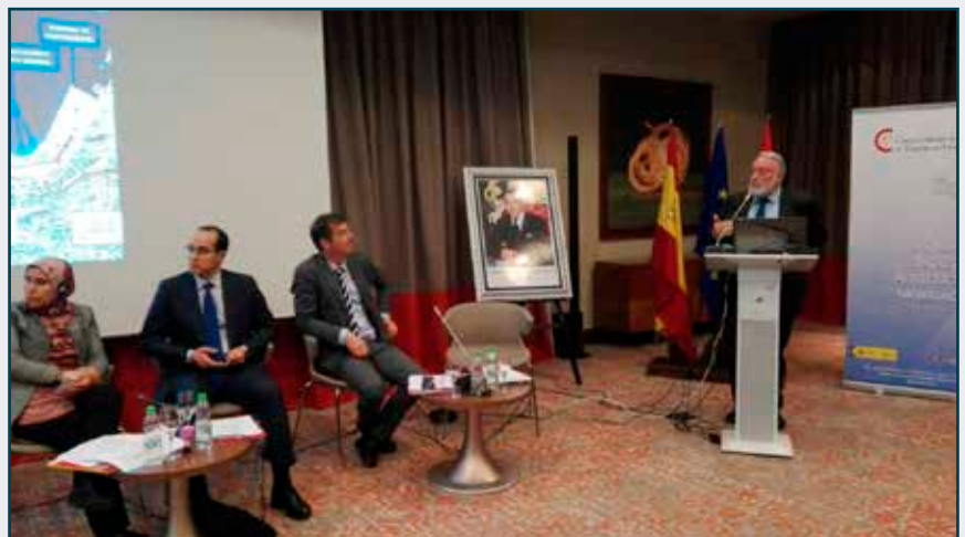
The Port of Vigo participates in the 6th Edition of the Spanish-Moroccan meeting of the Transport and Logistics sector.