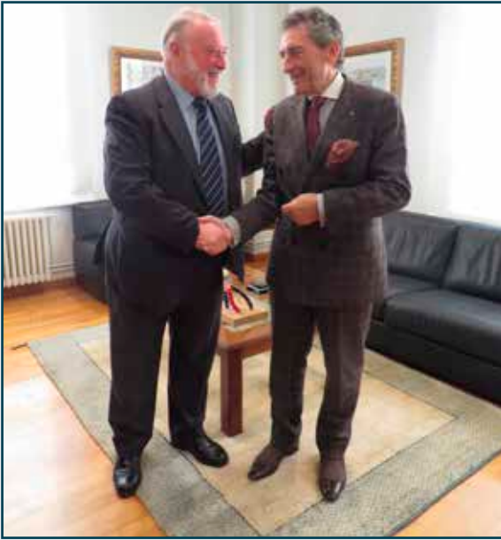
El Puerto de Vigo apuesta por el R.C. Celta para promocionar conjuntamente la imagen de la ciudad entre sus visitas. The Port of Vigo partners local football team Real Club Celta to promote together the image of the city among their visitors.